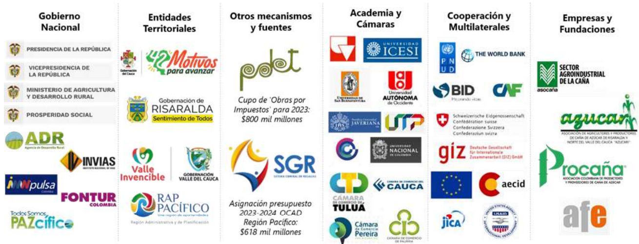
Figura 1. Potenciales aliados y cooperantes